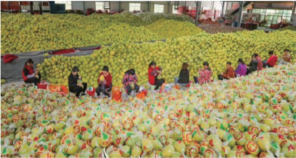
11月中旬,在梅縣區國家現代農業產業園石扇園區,工作人員在包裝水果。