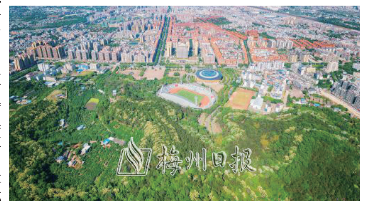
近年來,梅縣區新建、提升25個森林公園,改善了城鄉人居環境,實現“讓森林走進城市,讓城市擁抱森林”。